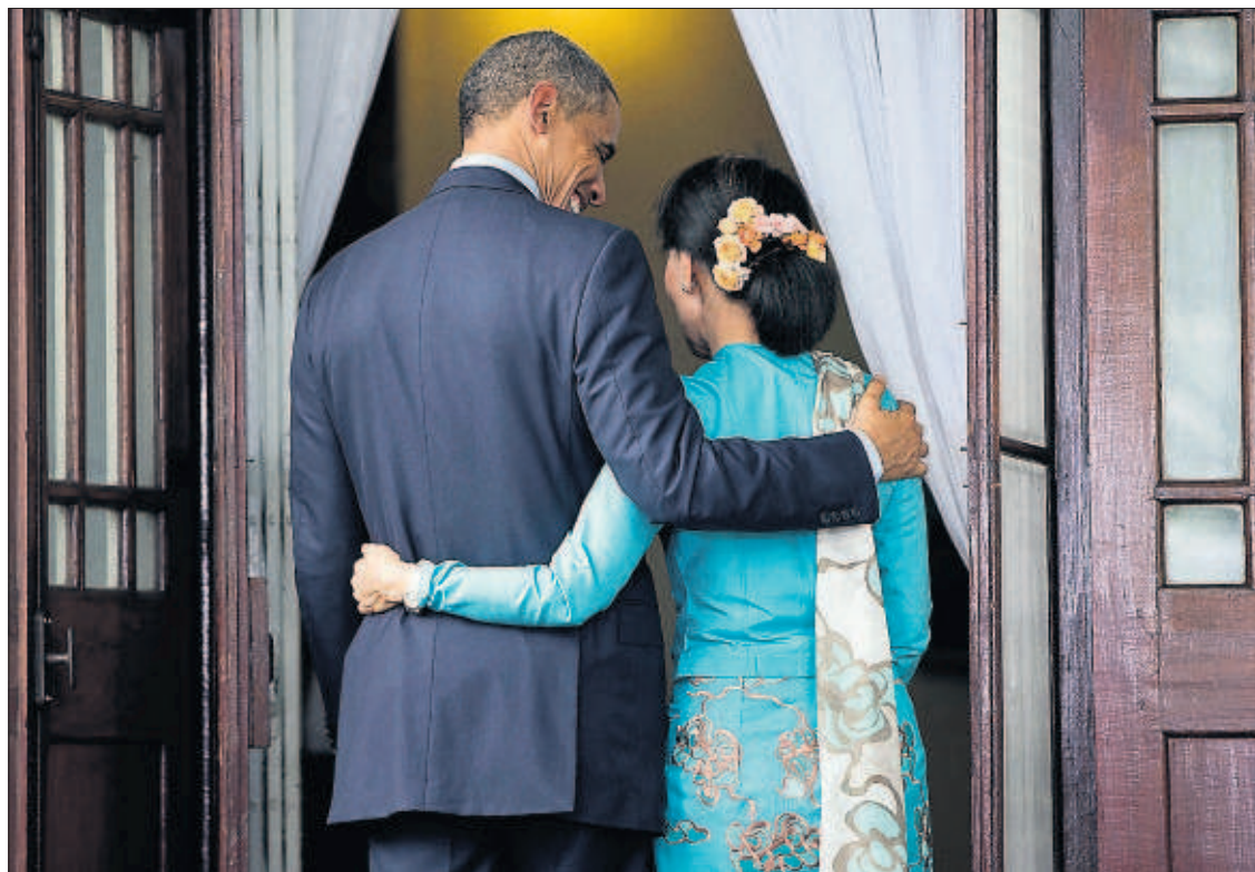
PAREJA DE PREMIOS NOBEL DE LA PAZ. El presidente de EE UU, Barack Obama, aprovechó ayer su viaje a Myanmar, donde asistió a la cumbre de la ASEAN, para encontrarse con la opositora birmana Aung San Suu Kyi. En la imagen, los dos, que han recibido el prestigioso galardón, entran en casa de la líder opositora.

pal inversión de Soros Fund, el vehículo del financiero, en una operación que supone un espaldarazo para FCC y también para España. Tanto Soros como Koplowitz tendrán en torno al 25% del capital, aunque las cifras finales dependen de los detalles de la operación, aún por fijar. PÁGINA 24