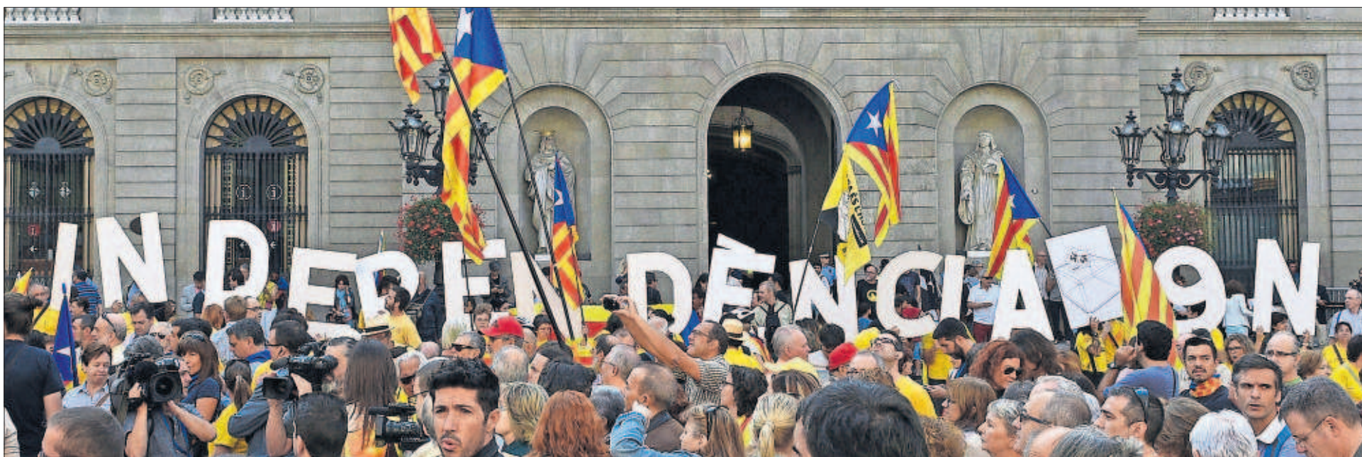
Un grupo de proindependentistas catalanes, ayer en la plaza de San Jaume de Barcelona, sede de la Generalitat.