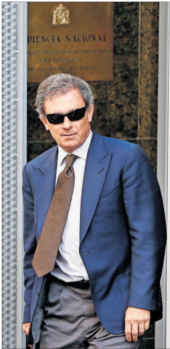
PUJOL FERRUSOLA LO NIEGA TODO. El hijo del expresidente catalán Jordi Pujol quedó en libertad ayer tras negar ante el juez Pablo Ruz el cobro de comisiones ilegales. En la foto, Jordi Pujol Ferrusola sale de la Audiencia. PÁGINA 14 / EDITORIAL EN LA PÁGINA 30