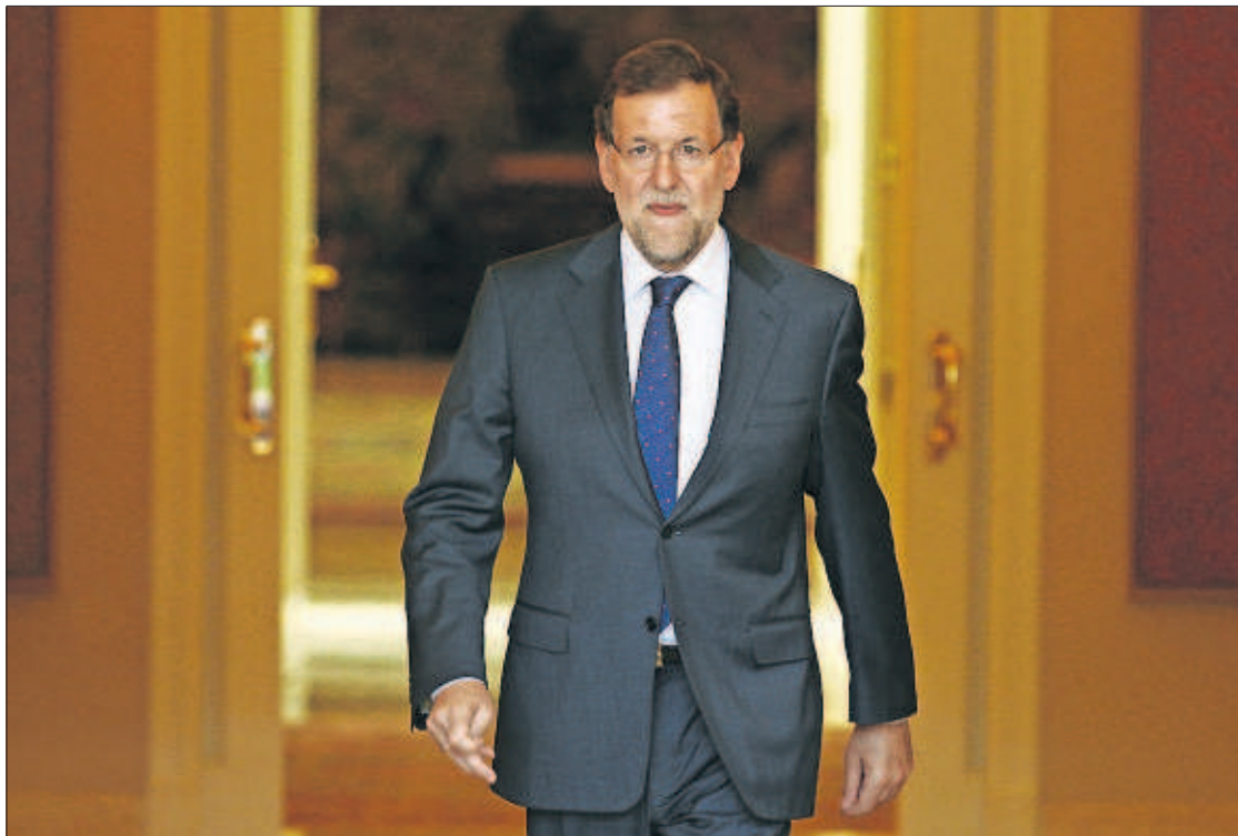
Mariano Rajoy, ayer en el palacio de la Moncloa en Madrid.