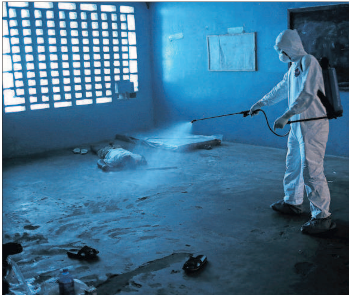
Desinfección de un cadáver en una escuela reconvertida en centro de aislamiento de ébola en Liberia.

El líder de Unió, Josep Antoni Duran, arremetió ayer contra Mariano Rajoy, al que le exigió más atención a la crisis catalana y menos triunfalismo ante la recuperación económica. "La falta de solución acabará afectando a la economía española y a su prima de riesgo. Costará muchos millones", dijo. PÁGINA 8