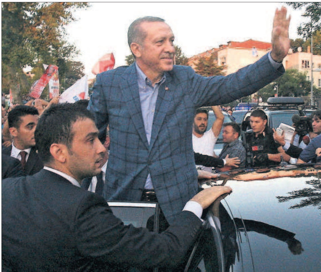
Recep Tayyip Erdogan saluda a sus seguidores ayer tras salir de su casa en Estambul.

La gran mayoría de las empresas del Ibex 35 ha visto mermados los beneficios esperados en el primer semestre del año por el impacto que la devaluación de ciertas divisas ha generado en sus resultados. Ha sido especialmente pernicioso el retroceso de monedas como el peso argentino y mexicano y el real brasileño. PÁGINA 19