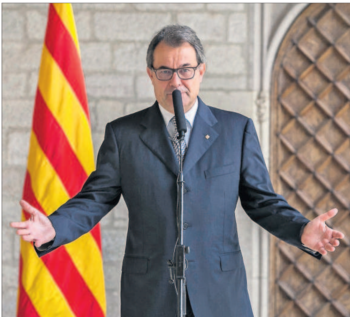
El presidente de la Generalitat, Artur Mas, ayer durante el anuncio de la renuncia de Jordi Pujol.