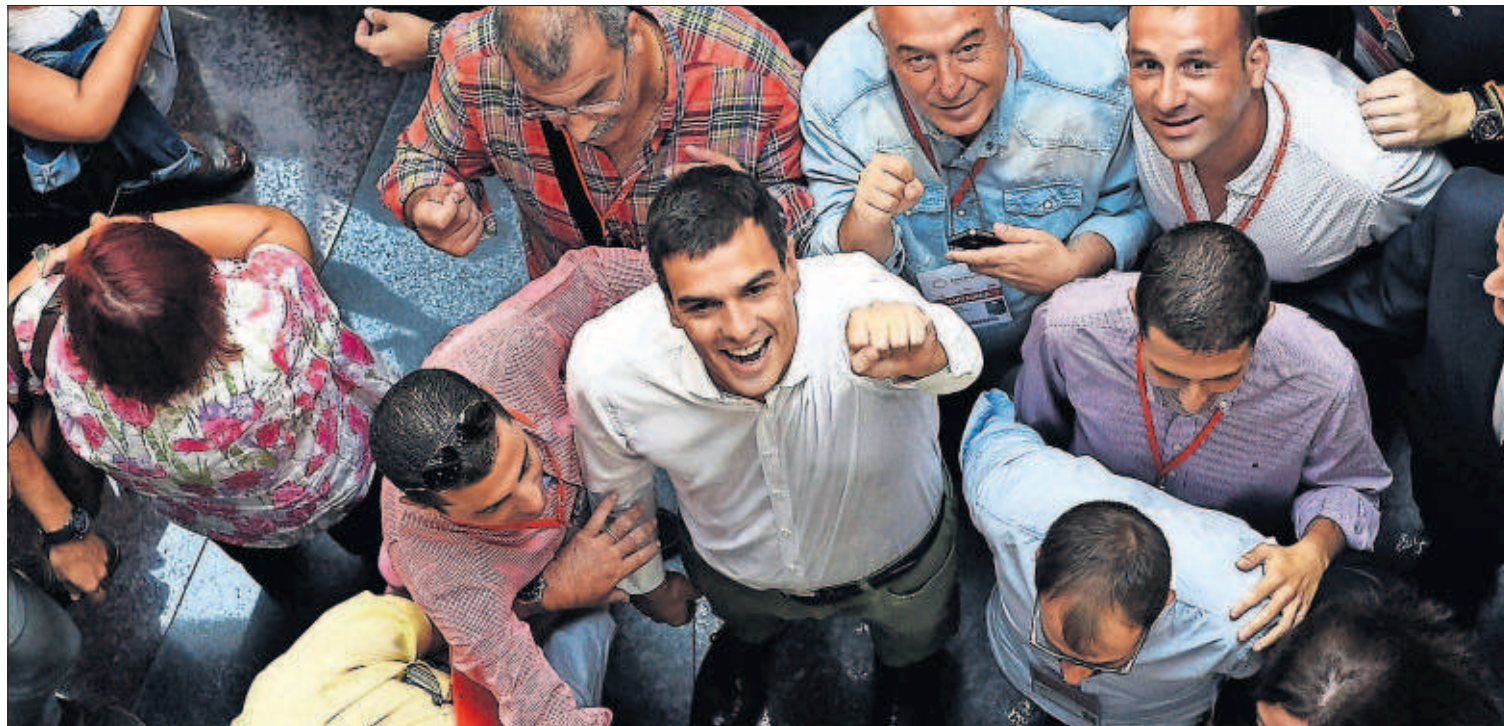
Pedro Sánchez (centro) saluda a su llegada al congreso extraordinario del PSOE, ayer en Madrid.