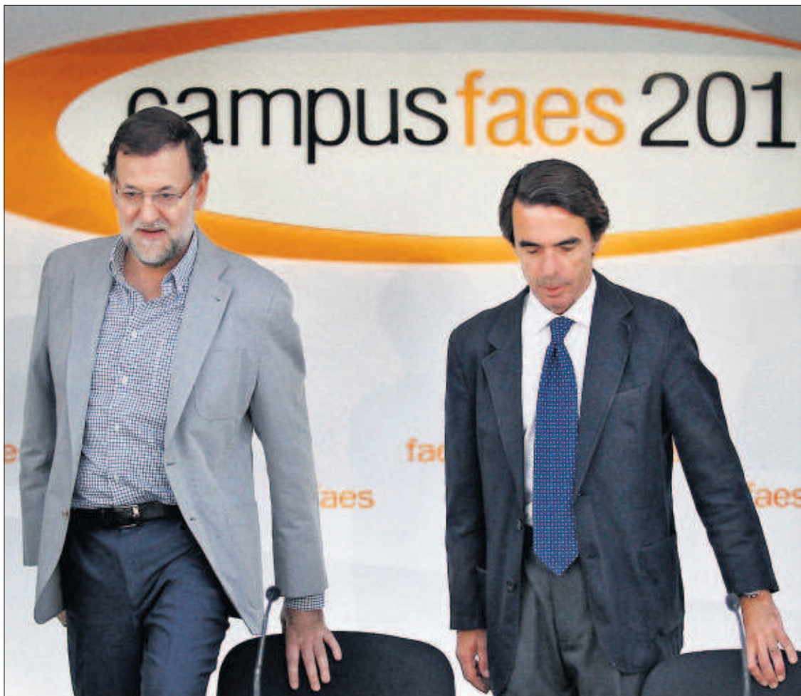
El presidente del Gobierno, Mariano Rajoy, ayer junto al expresidente José María Aznar.

En la última convocatoria del Tribunal de Cuentas para cubrir 14 plazas de informático, la mitad de los aspirantes aprobados eran secretarías de altos cargos. Meses antes, un empleado pronosticó ante notario qué candidatos serían elegidos. Acertó el 89%. PÁGINA 18