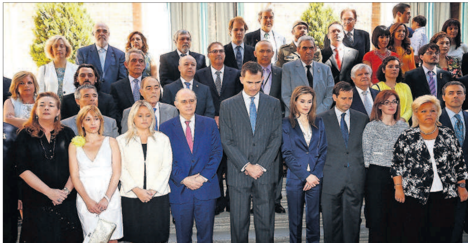
LOS REYES, CON LAS VÍCTIMAS DEL TERRORISMO. El primer acto oficial del Rey, tras ser proclamado el pasado jueves, fue un encuentro ayer en Madrid con 43 víctimas del terrorismo o familiares, ante los que alabó que hayan renunciado a la venganza. PÁGINA 14

El nuevo equipo de La Zarzuela PÁGINA 16