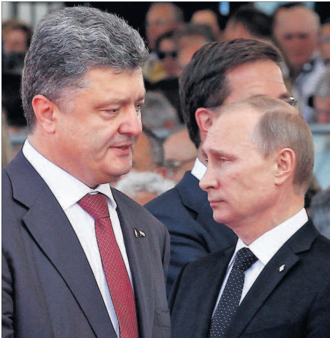
Los presidentes de Rusia, Vladímir Putin, y de Ucrania, Petro Poroshenko, ayer en la ceremonia.