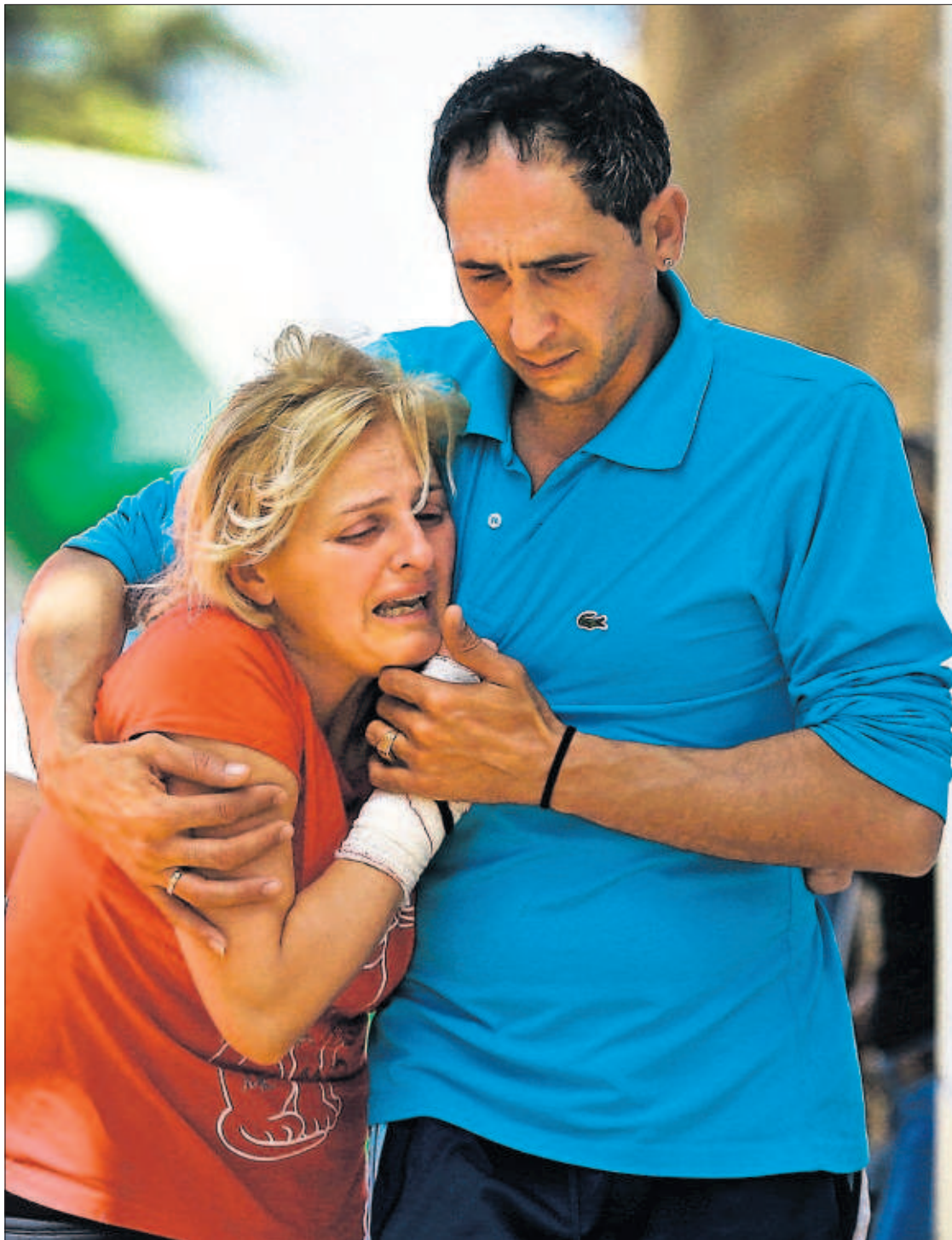
La madre de uno de los menores fallecidos, rota por el dolor, llora abrazada a su hermano.

Coincidiendo con la visita de Putin, la violencia regresó al este de Ucrania a dos días del referéndum de independencia de la región, que ni siquiera Moscú apoya. Los combates en el puerto de Mariúpol se saldaron con un número indeterminado de muertos —20 según Kiev, tres según los rebeldes—. Ambos bandos se acusaron de haber empezado el ataque en torno a edificios oficiales. PÁGINAS 3 Y 4