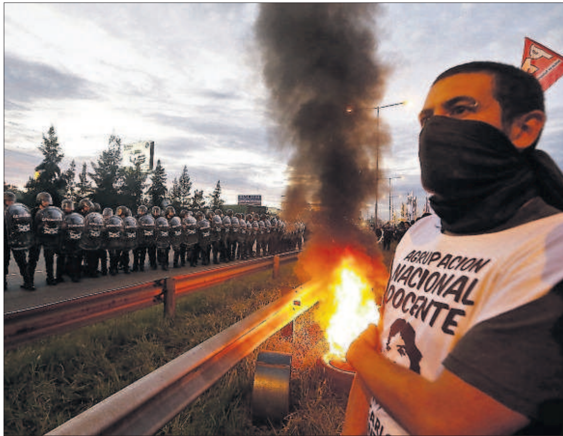
LA HUELGA GENERAL PARALIZA ARGENTINA. Buenos Aires y otras ciudades permanecieron ayer casi desiertas por el respaldo que tuvo la huelga convocada por los sindicatos opuestos al Gobierno de Cristina Fernández. Los piqueteros (en la foto) bloquearon las principales arterias y pararon el transporte. PÁGINA 4