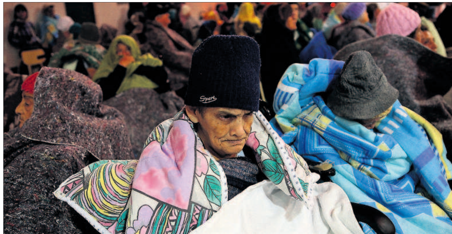
EVACUACIÓN MASIVA EN CHILE TRAS UNA ALERTA DE TSUNAMI. La costa norte de Chile sufrió en la noche del martes un terremoto de magnitud 8,2. Ante la alerta de tsunami, y con el catastrófico temblor de 2010 en la memoria, el Gobierno se apresuró a evacuar a casi un millón de personas del litoral. El seísmo solo produjo seis muertos. En la imagen, vecinos de Antofagasta durante su estancia en la calle. PÁGINA 8