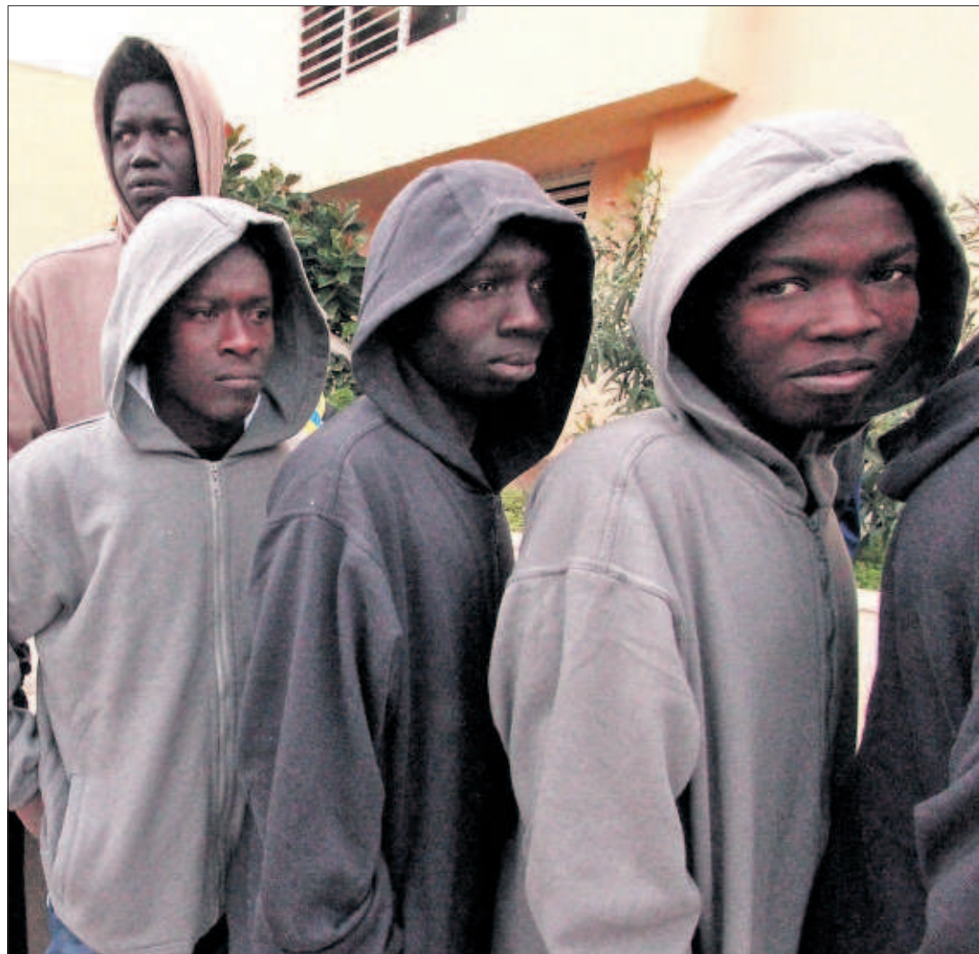
EN LA COLA PARA DOCUMENTARSE. Los ciudadanos subsaharianos que han saltado la valla fronteriza en los últimos días hacían ayer cola ante la comisaría de Melilla para documentarse.

En el proyecto de decreto que desde ayer está en exposición pública no aparece ni una referencia a la consulta soberanista para evitar que sea recurrido ante el Constitucional. PÁGINA 12