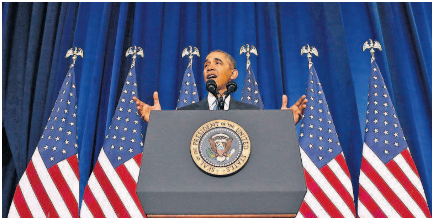
Barack Obama anuncia las reformas en los programas de vigilancia, ayer en Washington.

mañana”, sin que suponga un peligro para la seguridad. Aunque sí añadió que habrá controles judiciales para reducir el riesgo de usos inapropiados. “Nuestra libertad no puede depender de las buenas intenciones de quienes están en el poder, sino de la ley que restringe ese poder”, señaló Obama. PÁGINAS 2 Y 3