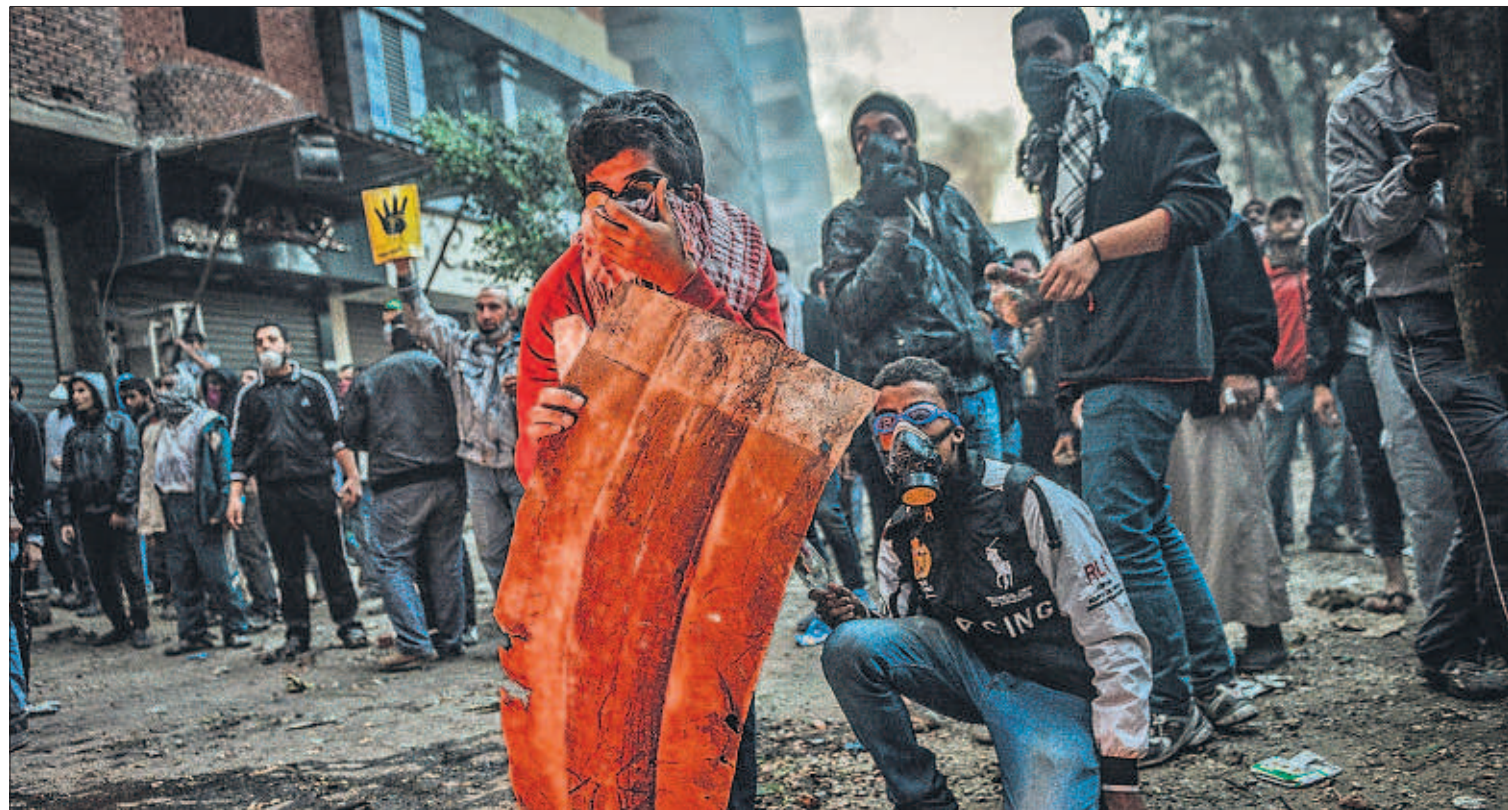
LA VIOLENCIA INCENDIA EGIPTO. Grupos de estudiantes afines a los Hermanos Musulmanes prendieron fuego ayer a la Facultad de Comercio de la Universidad de Al Azhar, en El Cairo. En los disturbios murió al menos una persona por disparos de la policía. En la noche anterior, los enfrentamientos en la capital egipcia entre manifestantes (en la imagen) y agentes se saldaron con cinco muertos. PÁGINA 11