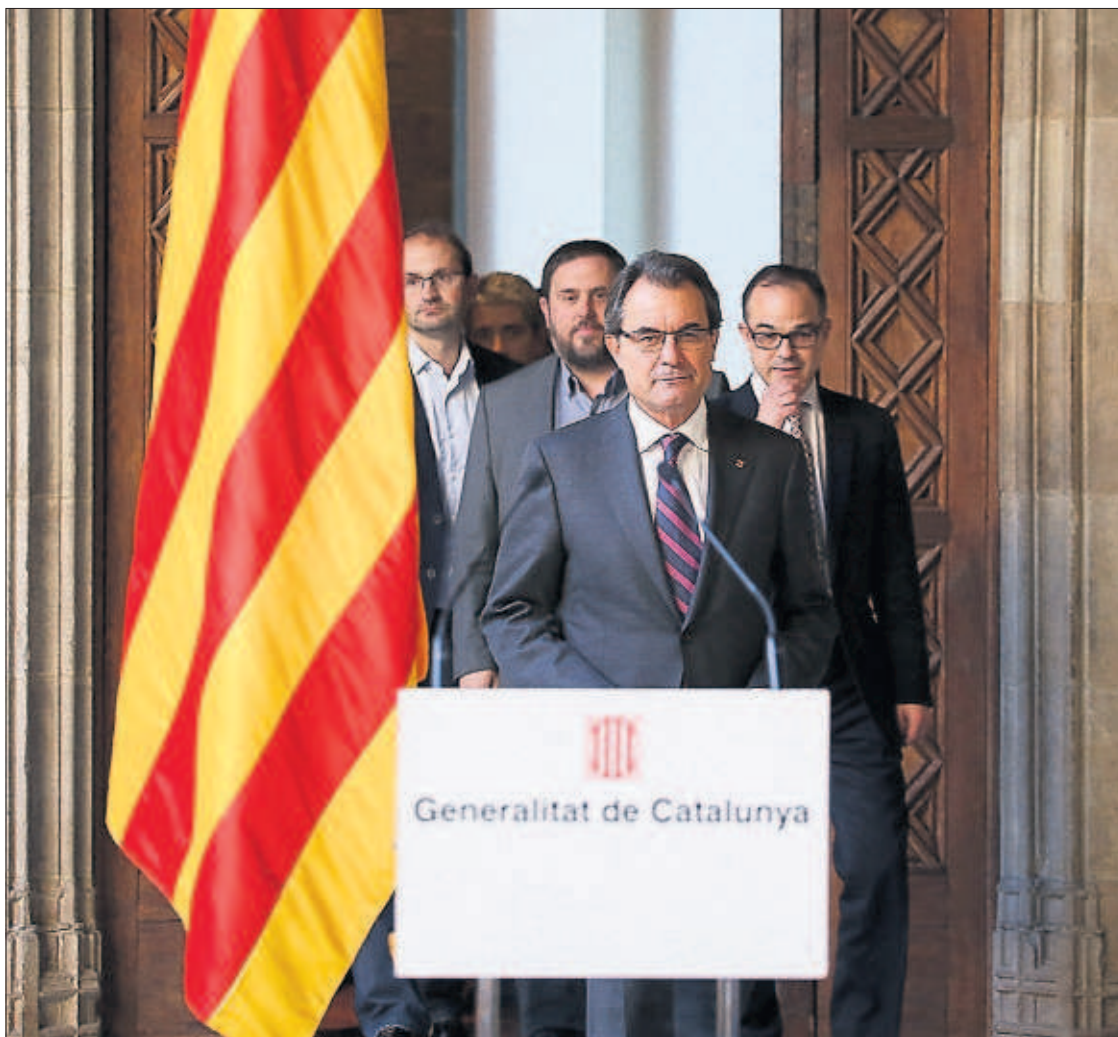
Artur Mas, junto a los líderes de los partidos que apoyan la consulta, en el palacio de la Generalitat.