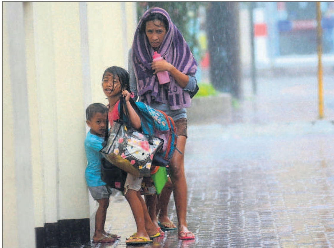
UN MILLÓN DE DESPLAZADOS POR EL SUPERTIFÓN. Haiyan, el tifón más potente del año con rachas hasta de 378 kilómetros por hora, causó cuatro muertos y el desplazamiento de un millón de personas al tocar tierra ayer en Filipinas. En la foto, una madre y sus hijos en la isla de Cebú. PÁGINA 8

Los beneficios de las compañías del Ibex 35 mejoraron un 13% entre enero y septiembre. El sector financiero, gracias a las menores provisiones, se ha convertido en el motor de las cuentas corporativas. La asignatura pendiente son las ventas, que siguen cayendo. PÁGINA 24