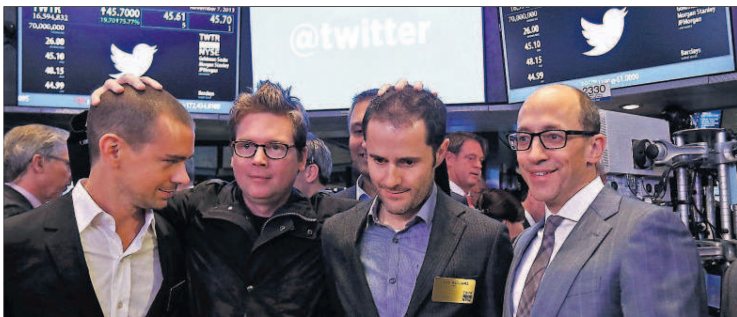
TWITTER VUELA ALTO EN BOLSA. La red social Twitter, cuyos fundadores aparecen en la imagen, se estrenó ayer en Bolsa con una fuerte subida que llegó a ser de más del 90%. El mercado valora la empresa en unos 20.000 millones de euros. PÁGINA 24

La revuelta en Bretaña contra una ecotasa, finalmente suspendida, y las protestas por la expulsión de la niña Leonarda son las gotas que han colmado el vaso de la crisis que padece el presidente socialista francés, François Hollande, el más impopular de la V República. Las acusaciones de improvisación e inactividad se multiplican. PÁGINAS 2 Y 3