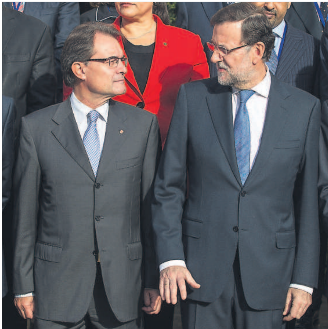
Artur Mas y Mariano Rajoy posan junto a los integrantes del Foro Económico del Mediterráneo.