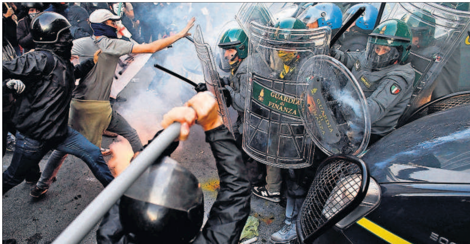
LA MARCHA DE ROMA CONTRA LAS CICATRICES DE LA CRISIS CONCLUYE CON DISTURBIOS. Unos petardos lanzados por encapuchados contra la sede del Ministerio de Economía en Roma fueron el detonante de graves altercados entre manifestantes y policías. En Portugal, en cambio, las manifestaciones convocadas contra los ajustes del Gobierno acabaron pacíficamente. / STEFANO RELLANDINI (REUTERS) PÁGINA 32

El silencio de ETA al requerimiento de la izquierda abertzale para que se desarme y permita a los presos acogerse a la reinserción individual agranda las diferencias entre la banda y Sortu. Hoy se cumplen dos años del anuncio del cese de los atentados, un aniversario marcado por el bloqueo de la política penitenciaria del Gobierno, pendiente de la sentencia de Estrasburgo sobre la doctrina Parot , que se conocerá mañana. El Ejecutivo confía en un dictamen ambiguo. PÁGINAS 14 A 16