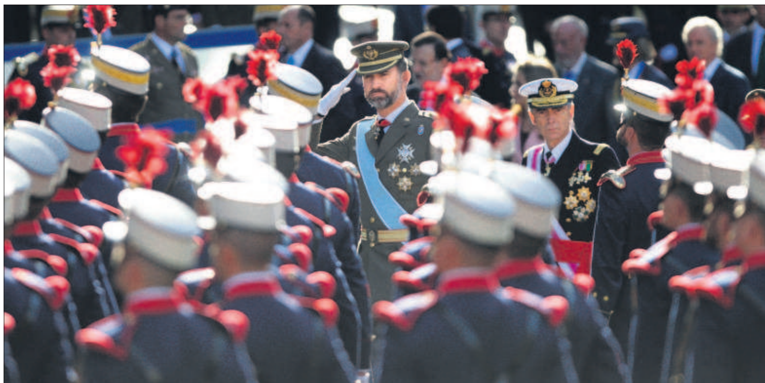
EL ESTRENO DEL PRÍNCIPE. Don Felipe presidió ayer por primera vez el desfile del 12-O en ausencia del Rey, convaliente de su última operación. El Monarca quiso estar presente y el Príncipe leyó un mensaje en su nombre: “Es un día para celebrar lo que nos une”.

El Ministerio de Educación ha endurecido los requisitos para mantener las becas. Con los nuevos criterios, que castigan a los alumnos que suspendan la mitad de las asignaturas, deben devolver la ayuda unos 20.000 estudiantes, más del doble que hasta ahora. PÁGINAS 38 Y 39