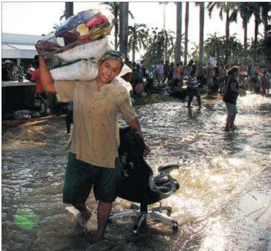
DOS TORMENTAS SIEMBRAN EL DESASTRE EN MÉXICO. Las dos costas de México han padecido el paso simultáneo de tormentas tropicales, que han dejado al menos 57 muertos y 77 municipios afectados. En la imagen, saqueos en Acapulco, donde hay 36.000 turistas atrapados. PÁGINA 8

El proyecto de ley del nuevo Código Penal que aprobará en breve el Consejo de Ministros recoge el nuevo delito con penas que van de seis meses a seis años de cárcel, la retirada de los contenidos pirateados y, en los casos más extremos, el bloqueo de la página web. Esta propuesta, redactada desde Justicia, ha dado lugar a una acerbada disputa entre el Ministerio de Industria —presionado por los operadores de Internet que piden una ley más suave— y el de Cultura —presionado por los creadores que reclaman más dureza para evitar la sangría que sufren sus ingresos—. PÁGINAS 38 Y 39