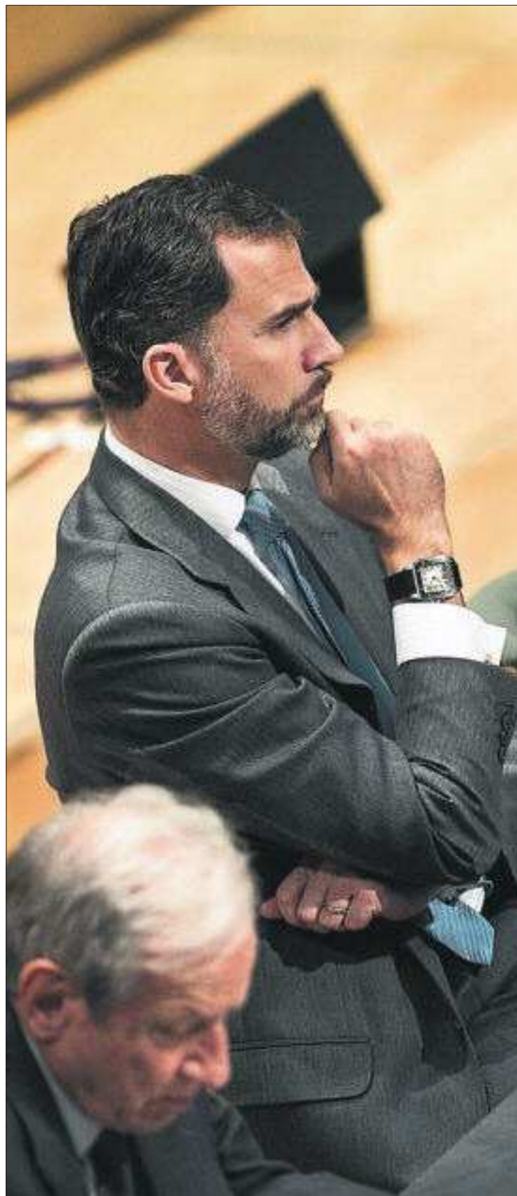
El Príncipe, ayer en la entrega de despachos a jueces.