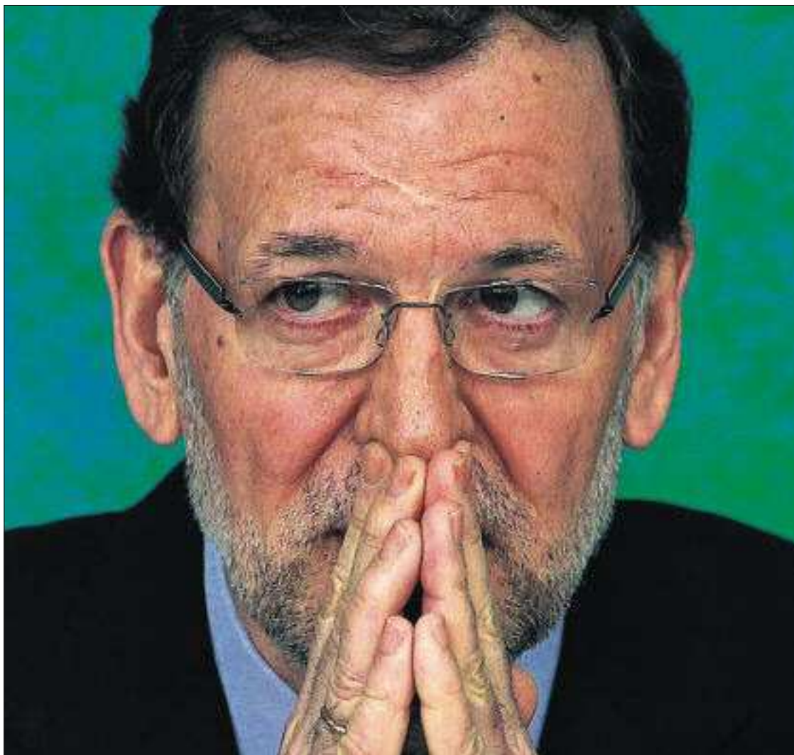
Mariano Rajoy, durante su intervención de ayer ante la cúpula del Partido Popular.