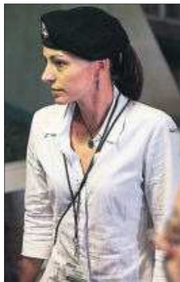
Tanja Nijmeijer.

Tiene 34 años y lo que vivió en Colombia en 2001 la llevó a enrolarse en la guerrilla. Tanja Nijmeijer es ahora portavoz de las FARC en el proceso de paz iniciado el 19 de noviembre en Cuba. "Queremos hacer reformas radicales. De eso tratan nuestras conversaciones con el Gobierno". PÁGINA 3