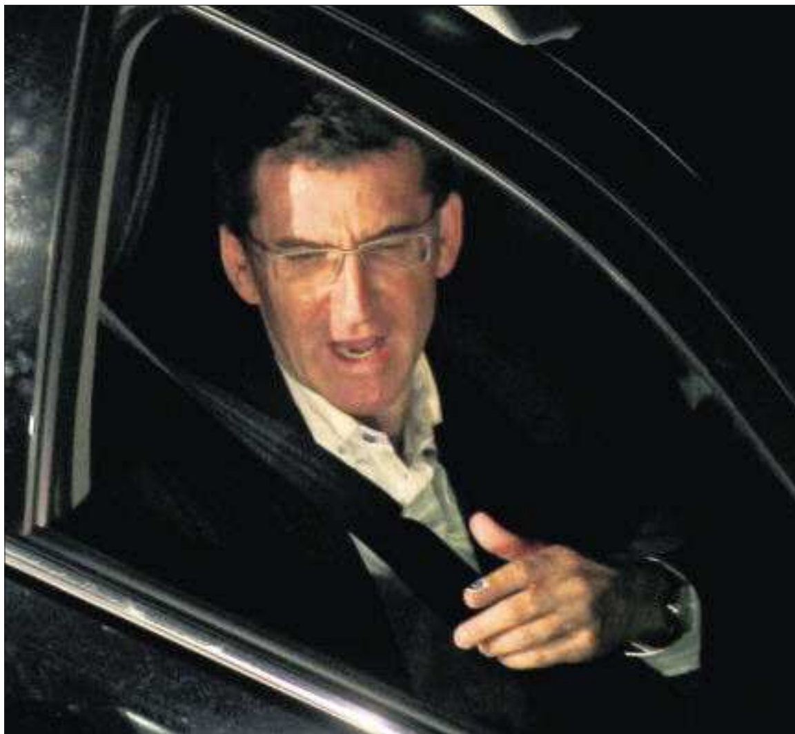
El popular Alberto Núñez Feijóo, anoche, a su llegada a la sede del PP en Santiago.