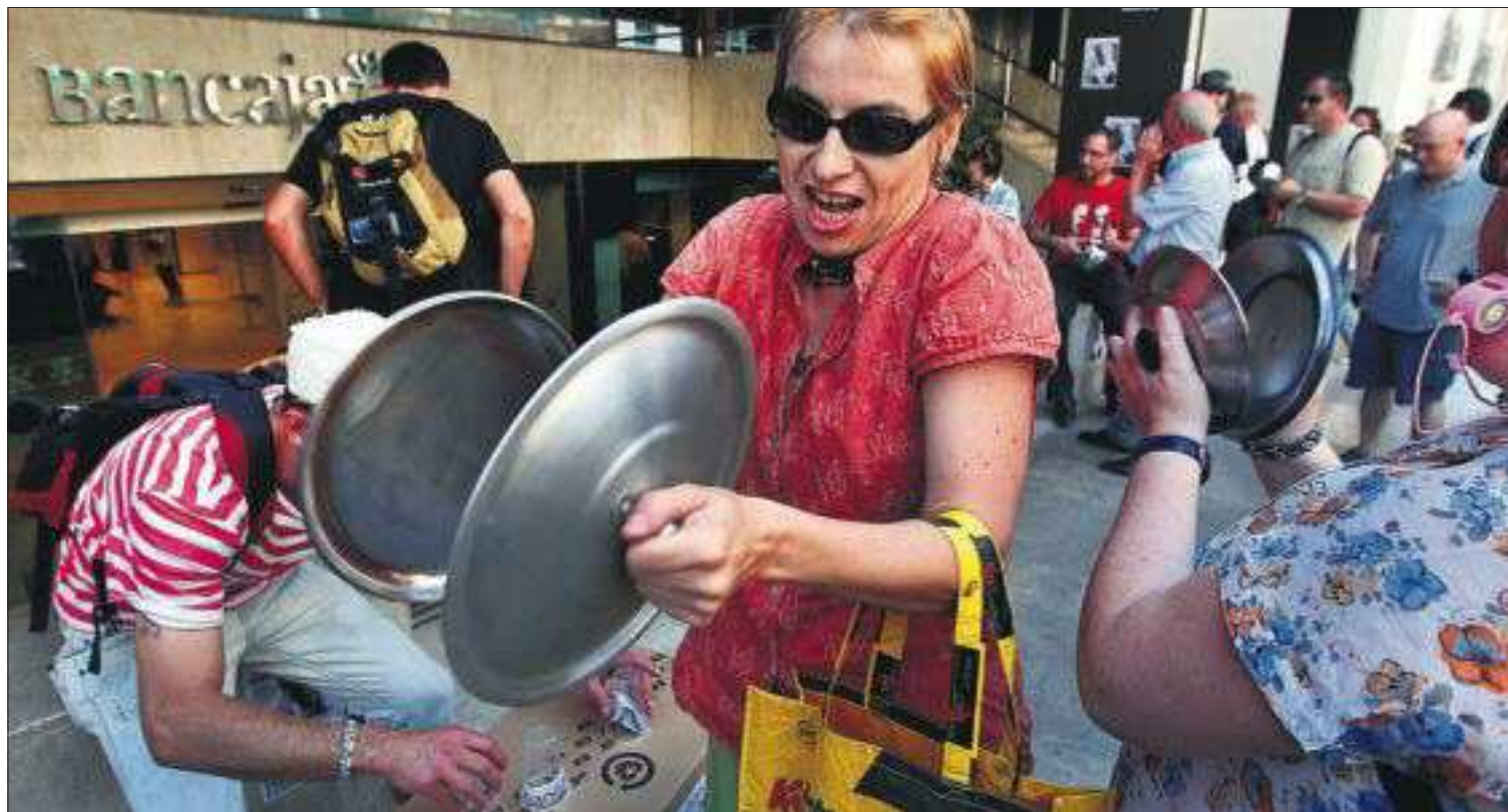
CACEROLADAS, FLAMENCO Y MAYORES LLEVAN LA PROTESTA A LOS BANCOS. Ya sean yayoflautas (mayores indignados), caceroladas o grupos de flamenco, todo vale para protestar en las oficinas de Bankia de Madrid, Barcelona o Valencia (foto). PÁGINA 22

Demasiado grande para caer. Este es el argumento que lanzó ayer el ministro de Hacienda, Cristóbal Montoro, para confiar ciegamente, en estos momentos de desconcierto por la crisis, en que Europa no dejará a la deriva a España porque arrastraría consigo al euro. El Ejecutivo considera que algo se está moviendo en Europa, y que un mecanismo que permita inyectar dinero a los bancos, sin pasar por los Gobiernos, es la única vía para evitar la fragmentación del euro. PÁGINA 10