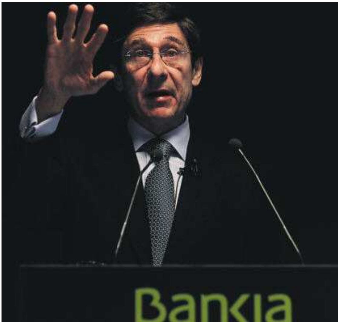
José Ignacio Goirigolzarri, tras informar ayer de los planes de saneamiento de Bankia.