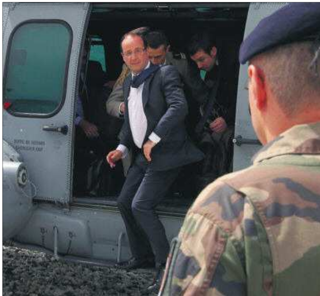
HOLLANDE COORDINARÁ CON LOS ALIADOS LA SALIDA DE AFGANISTÁN. El presidente de Francia, François Hollande, prometió ayer en Kapisa (Afganistán), donde visitó a las tropas de su país, que el repliegue de sus fuerzas se hará de manera "coordinada con los aliados". PÁGINA 3