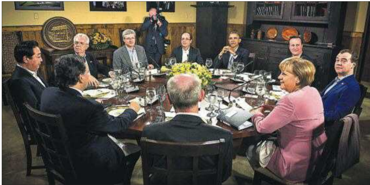
MERKEL MUESTRA SU CARA AMABLE EN EL G-8. La canciller alemana, Angela Merkel, suavizó su rechazo a la estrategia del estímulo económico en el G-8. En la foto, a partir de Merkel y en el sentido de las agujas del reloj: Herman Van Rompuy, José Manuel Durão Barroso, Yoshihiko Noda, Mario Monti, Stephen Harper, François Hollande, Barack Obama, David Cameron y Dimitri Medvedev. PÁGINAS 4 Y 5