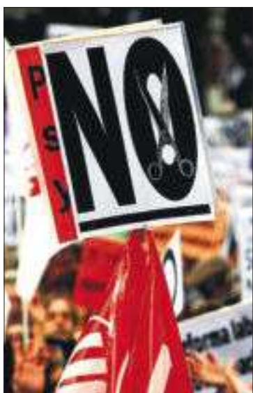
Manifestación de Madrid.

Iñaki Urdangarin está dispuesto a negociar un pacto con la fiscalía que implique el pago de 1,7 millones de euros (la mitad de lo supuestamente defraudado a la Administración por el Instituto que dirigía junto a su socio Diego Torres). El duque de Palma trataría de evitar así un juicio que podría acabar salpicando la imagen del Rey. PÁGINA 12