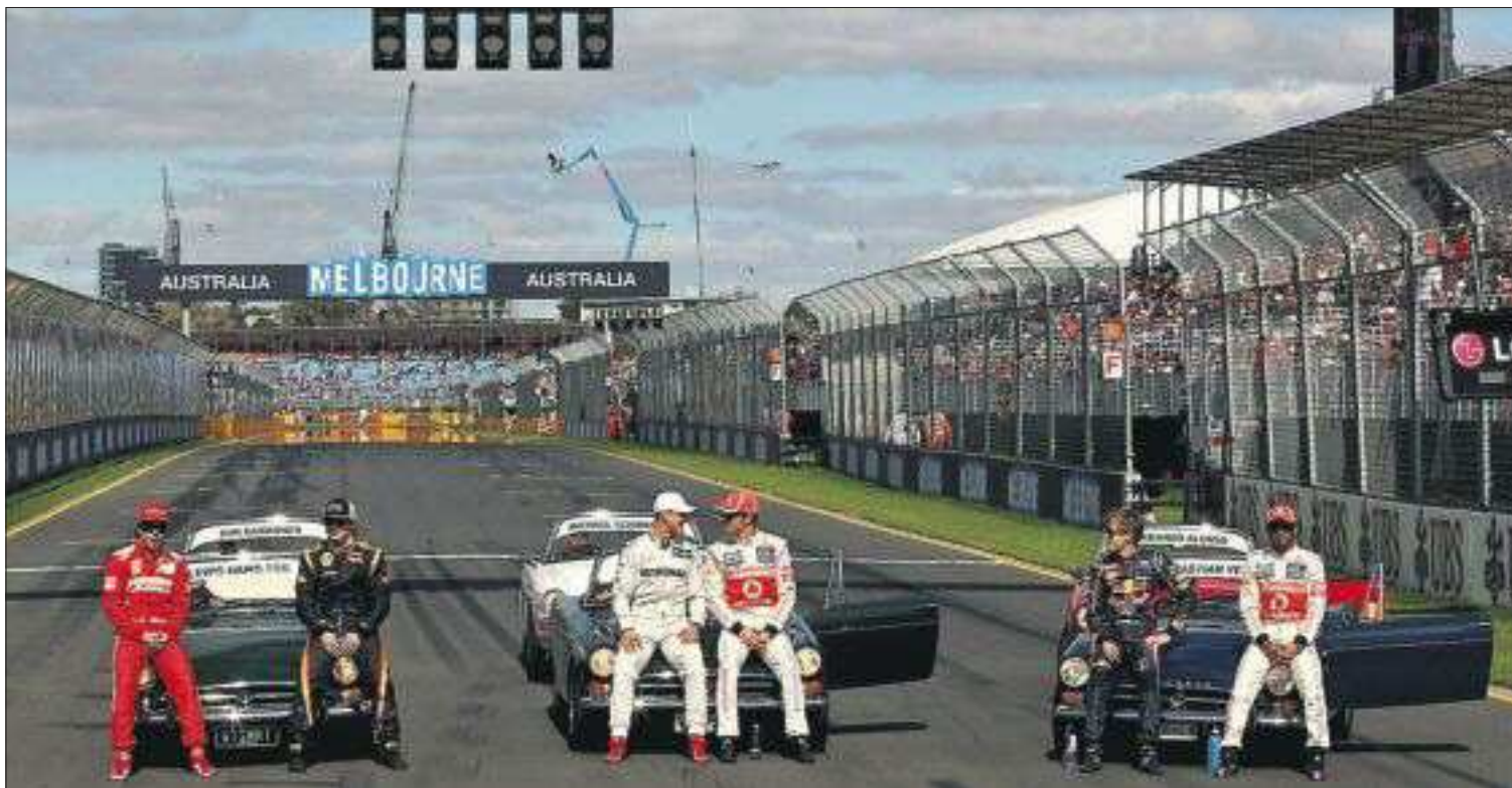
LA F-1 CON MÁS CAMPEONES ARRANCA CON VICTORIA DE BUTTON. Lo nunca visto. El Mundial de F-1 con más campeones en pista arrancó ayer en Australia con victoria de Jenson Button (McLaren). Antes de la carrera posó el sexteto que promete una temporada apasionante: de izquierda a derecha, Alonso (que fue quinto ayer), Raikkonen, Schumacher, Button, Vettel y Hamilton. PÁGINAS 54 Y 55