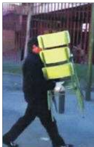
Un operario, en el colegio Santa Illa.