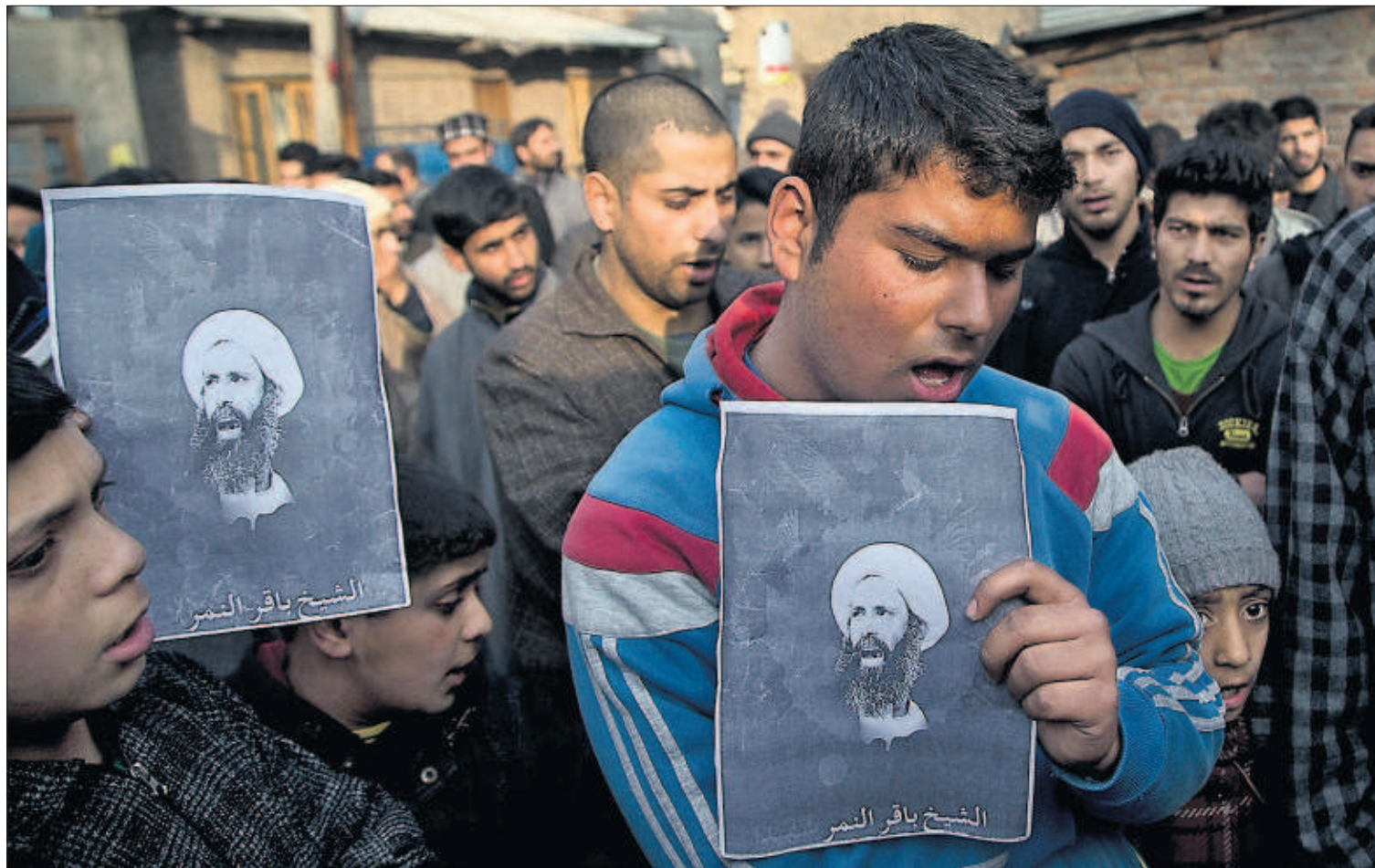
Musulmanes chiíes de Srinagar, en la provincia india de Cachemira, lamentan la muerte del jeque Nimr Baqr al Nimr.

Las metrópolis, en alerta por la contaminación