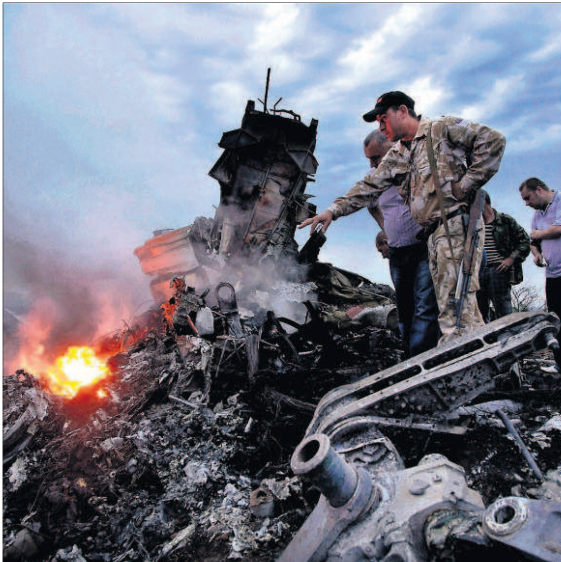
Varias personas observan los restos del avión estrellado en la región ucraniana de Donetsk.

Los presidentes de Estados Unidos, Barack Obama, y de Rusia, Vladímir Putin, abordaron la tragedia durante una conversación telefónica sobre la crisis en Ucrania. PÁGINAS 2 Y 3