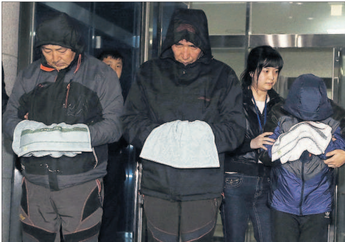
EL CAPITÁN DEL FERRI COREANO PIDE PERDÓN. El capitán del ferri surcoreano hundido el miércoles fue detenido ayer junto a otros dos tripulantes, entre ellos la tercera oficial (a la derecha), de 26 años, que en el momento de la tragedia estaba al timón por primera vez. Hay más de 30 muertos y 273 pasajeros desaparecidos. "Inclino mi cabeza ante las familias de las víctimas", dijo el capitán (centro de la foto). / AP PÁGINA 8

Kazuhiro Tsuboi, un extrabajador de Fukushima, es uno de los 357 vecinos autorizados a regresar a casa tres años después. "Mis nietos no juegan fuera. A mí no me importa la radiación". PÁGINAS 32 Y 33