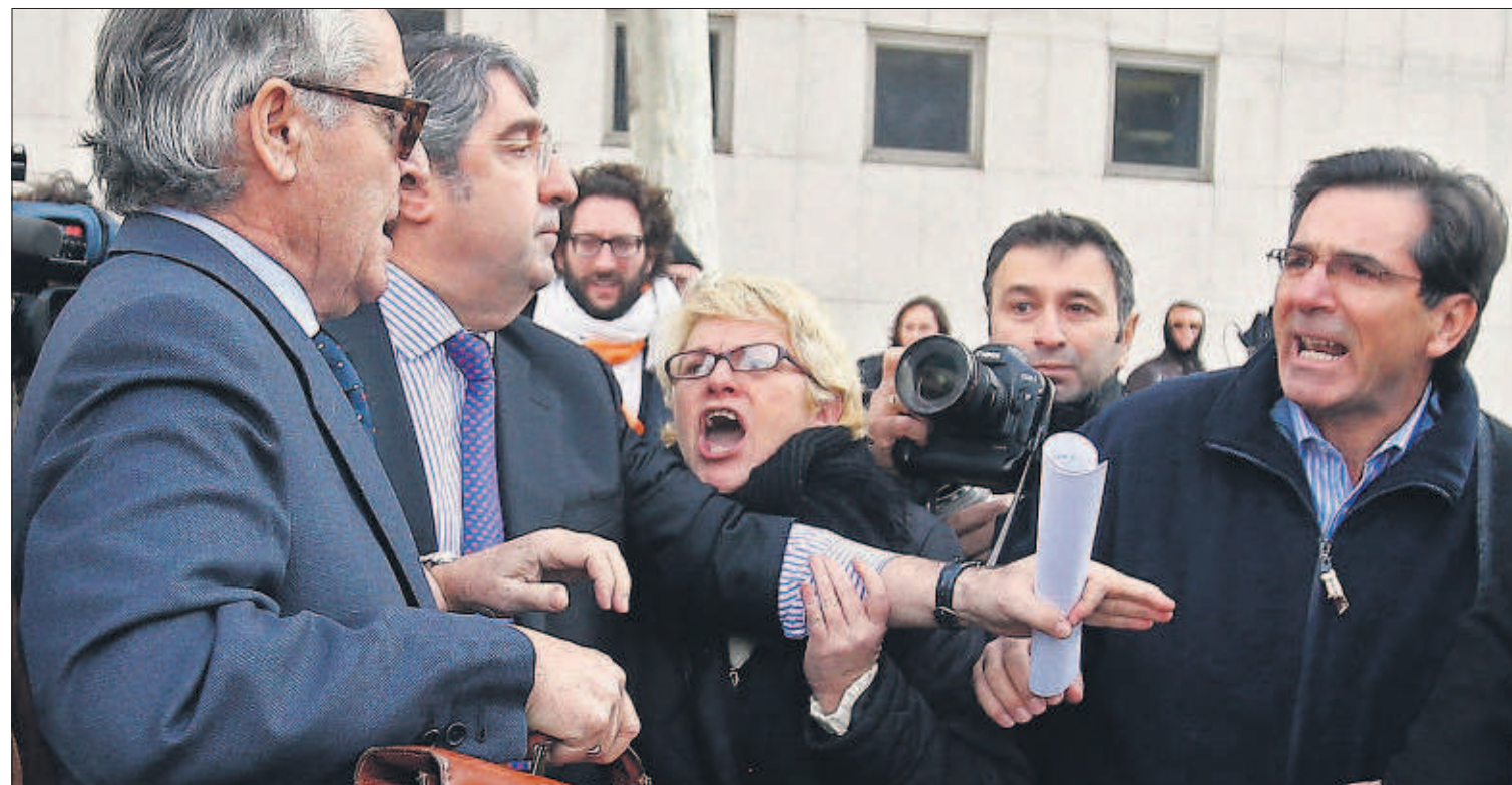
EL EXBANQUERO MIGUEL BLESA, INCREPADO A LA SALIDA DEL JUZGADO. Un grupo de preferentistas de Caja Madrid increpó ayer al expresidente de la entidad Miguel Blesa que declaró ante el juez por la compra del City National Bank de Florida. PÁGINA 24

Una oleada de atentados y fuertes enfrentamientos entre la policía y los partidarios del derrocado presidente Mohamed Morsi causaron casi una veintena de muertos y decenas de heridos en Egipto. Los ataques han marcado el tercer aniversario de la revolución que acabó con 30 años de régimen de Mubarak. PÁGINAS 2 Y 3