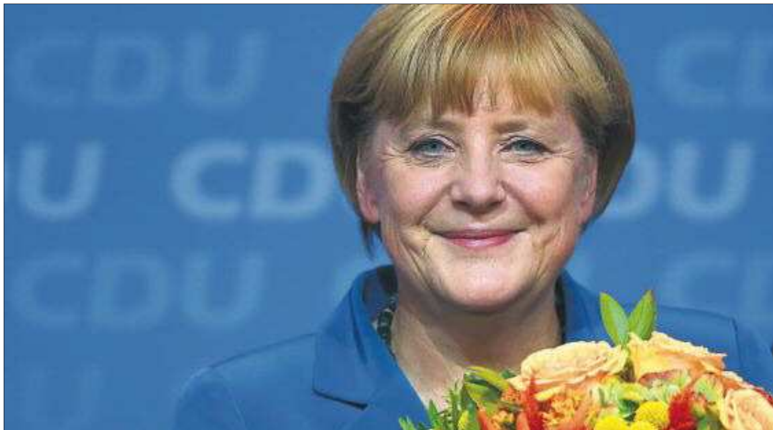
Angela Merkel comparece ante sus simpatizantes en la sede de la CDU, tras conocerse los primeros resultados.