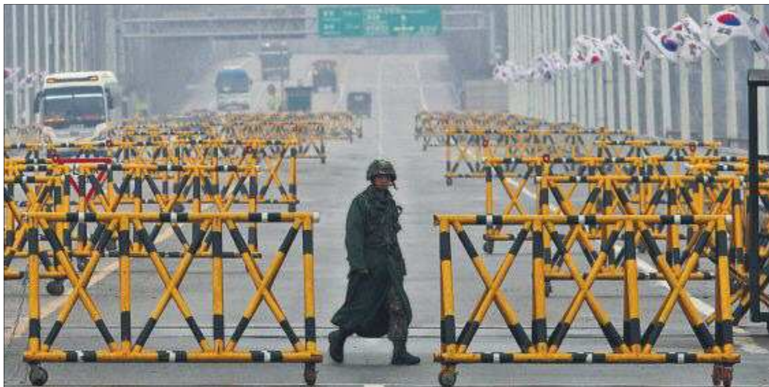
LAS BARRERAS ENTRE LAS DOS COREAS SE MULTIPLICAN. La dinastía estalinista en el poder en Pyongyang, encabezada ahora por Kim Jong-un, mantiene en vilo con sus amenazas a Corea del Sur y sus aliados. En la imagen, un soldado surcoreano patrulla en el llamado puente de la Unificación entre ambas Coreas, en Panmunjom, tras el regreso de trabajadores de la zona industrial conjunta.