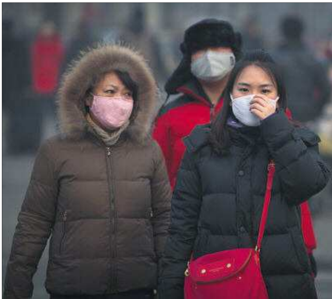
PEKÍN NO PUEDE RESPIRAR. El Gobierno de la capital china pidió ayer a sus 20 millones de habitantes que no salieran a la calle —o solo con mascarillas— porque el alto nivel de contaminación que sufre la ciudad ha superado casi tres veces el nivel considerado peligroso para la población. PÁGINA 7

Los españoles están convencidos de que el nivel de corrupción en la vida política es muy elevado, como lo constata el último sondeo de Metroscopia para EL PAÍS. Noventa y seis de cada 100 ciudadanos lo sostienen y el porcentaje es muy similar entre los votantes de los dos grandes partidos (95% en el caso del PP y 97% en el del PSOE). Este estado de opinión se agrava ante el hecho de que el 95% de los encuestados cree que los partidos protegen a sus militantes corruptos en lugar de denunciarlos y expulsarlos, pero una mayoría de ciudadanos también señala que parte del problema reside en que muchos votantes siguen apoyando listas con candidatos corruptos. Pese a todo, opinan los ciudadanos, los políticos corruptos son una minoría que perjudica la imagen de todos. Con el PP en caída libre electoral, los españoles abogan por un pacto de Estado para afrontar la crisis, pero lo ven inviable. PÁGINAS 12 Y 13