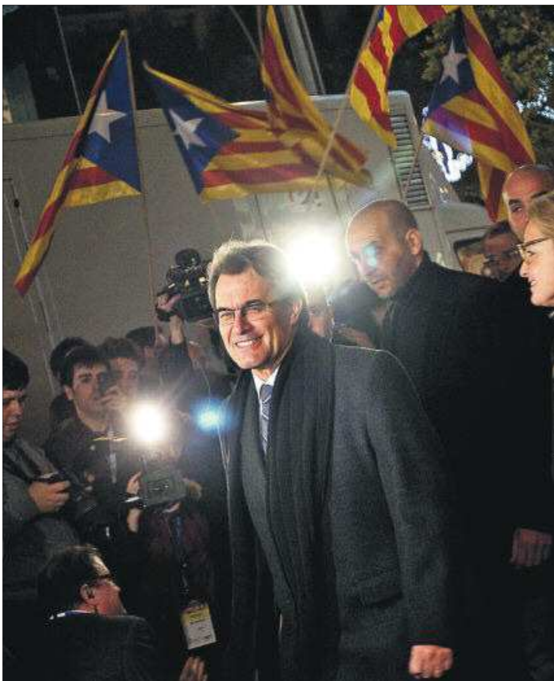
Artur Mas, a su llegada anoche a la sede electoral de Convergència, en Barcelona.

El 25-N representa un fiasco personal de Mas PÁGINA 34