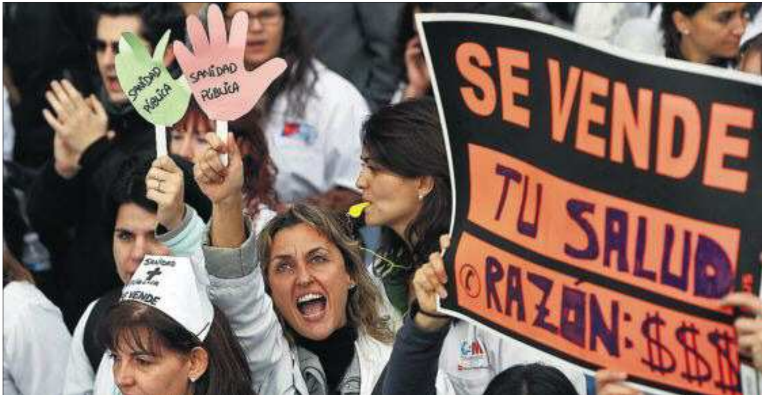
MAREA BLANCA EN MADRID A FAVOR DE LA SANIDAD PÚBLICA. Miles de personas, en su gran mayoría médicos y personal sanitario, marcharon ayer desde los hospitales de Madrid a la puerta del Sol para protestar contra los planes del Gobierno regional, del PP, de privatizar o reconvertir los centros sanitarios públicos. Hay una veintena de encierros en marcha y una huelga de cuatro días en ciernes. PÁGINA 35