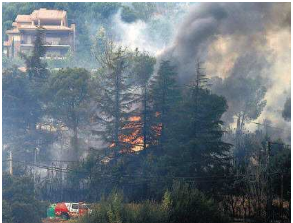
JAVIER LIZÓN (EFE)

Los republicanos de EE UU arrancan hoy su convención en Tampa (Florida) con el objetivo de recuperar su imagen de partido de Gobierno, frente al extremismo ideológico del Tea Party. El candidato Mitt Romney tratará de unir fuerzas con un mensaje centrista para poder obtener la victoria en noviembre. PÁGINAS 2 Y 3