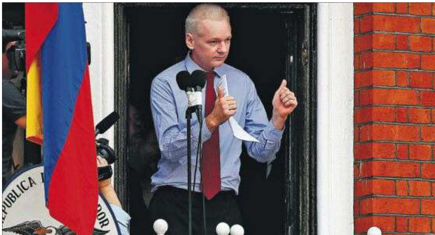
Julian Assange se dirige a la prensa y a sus seguidores desde el balcón de la Embajada de Ecuador en Londres.

El ministro de Medio Ambiente, Miguel Arias Cañete, ha avisado a las constructoras que terminará con las prácticas que han provocado un sobrecoste de 1.531 millones de euros en las obras hidráulicas contratadas por la Administración central entre 2004 y 2012. Esa desviación supone un incremento del 29% del presupuesto con el que las constructoras lograron la adjudicación de la obra, según un informe interno del ministerio. PÁGINA 18