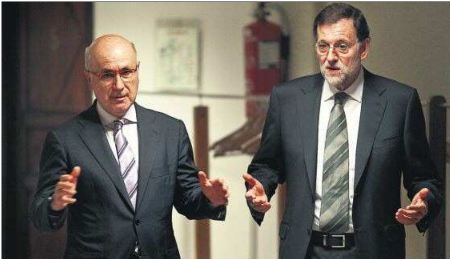
Josep Antoni Duran, portavoz parlamentario de CiU (izquierda), y Mariano Rajoy conversan ayer en los pasillos del Congreso.

La Generalitat da el paso asfixiada por 42.000 millones de deuda ● Rajoy busca apoyos en el exterior ● El exgobernador del Banco de España culpa al PP de la crisis de confianza