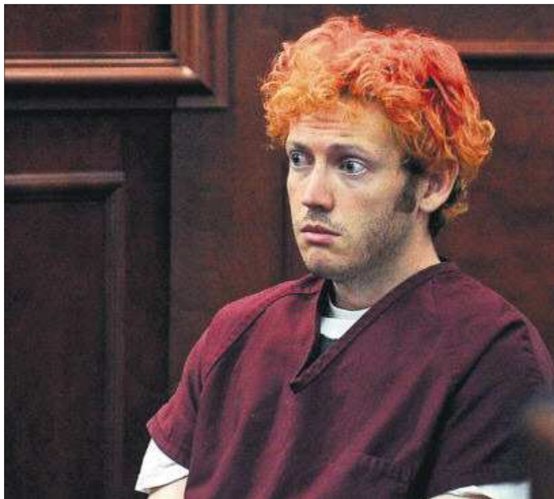
LA MIRADA DEL ASESINO DE DENVER. Con la mirada perdida y aire ausente, y el pelo teñido de rojo, James Holmes, de 24 años, detenido por matar el viernes pasado a 12 personas en un cine de Denver (EE UU), compareció ayer ante el juez. La fiscal dijo que considerará pedir la pena de muerte. PÁGINA 5

El PP sostiene que la restricción del aborto defiende a los “más débiles”