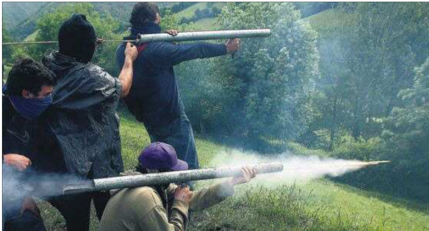
EL CONFLICTO MINERO SE RECRUDECE. Otra jornada de huelga en defensa de las ayudas al carbón en Asturias, y ya van 16. Los mineros volvieron a protestar ayer con cortes de tráfico en carreteras y líneas ferroviarias, quema de neumáticos y cruce de troncos, y hasta el lanzamiento con proyectiles de fuegos artificiales contra la Guardia Civil (en la foto, los altercados de Campomanes). Nueve trabajadores fueron detenidos. PÁGINA 15

Naciones Unidas ha documentado la tortura sistemática y el asesinato de niños, que también son utilizados como escudos humanos, por parte del régimen de Bashar el Asad en Siria. "No habíamos visto nada igual hasta ahora, quizás en Congo o Ruanda", dijo Alec Wargo, responsable del informe de la ONU que estudia la violencia contra menores. Los datos de la ONU tampoco exculpan a la oposición, que recluta a niños para el frente. PÁGINAS 4 Y 5