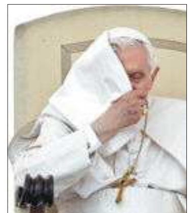
El papa Benedicto XVI.